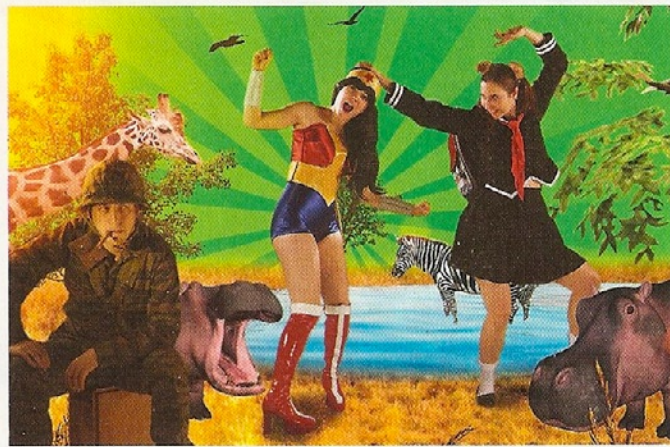
«YOKO-NI» Un spectacle hommage au nouveau monde des univers virtuels.