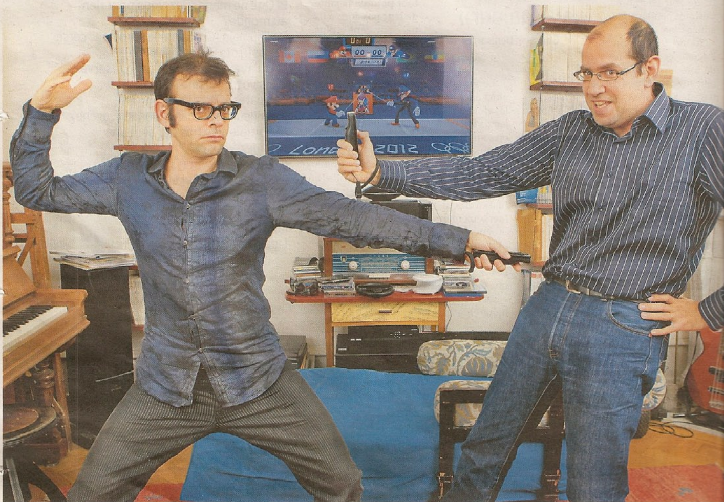
Le metteur en scène et l'écrivain se sont plongés dans l'univers parfois infernal des jeux vidéo le temps d'une pièce.

«Yoko-Ni», Usine à gaz, Nyon, 26 et 27 janvier. Théâtre Benno Besson, Yverdon, 1 er février. CPO, Lausanne du 3 au 5 février, du 7 au 12 février, du 14 au 19 février. Centre culturel de Delémont, 23 et 24 février.