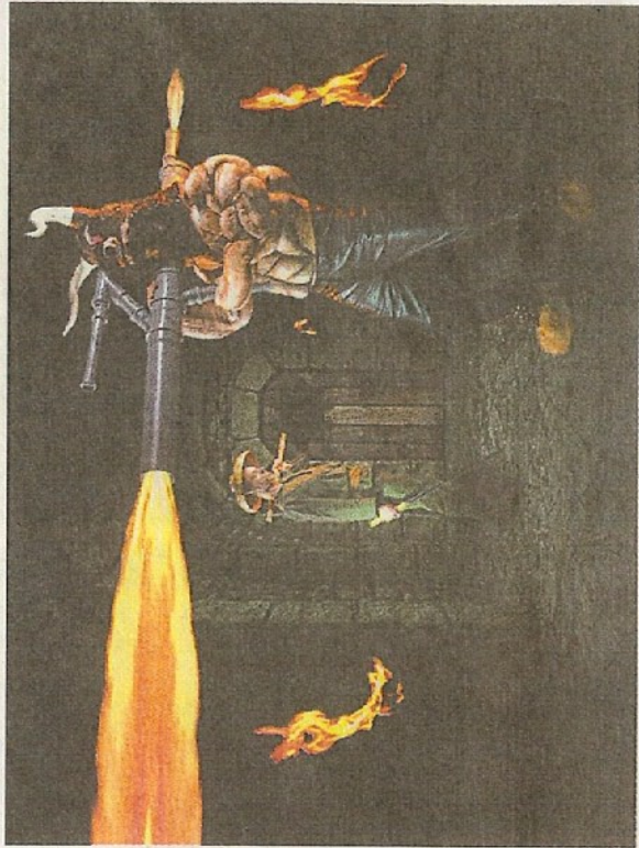
Un des visuels annonçant le spectacle Yoko-Ni.