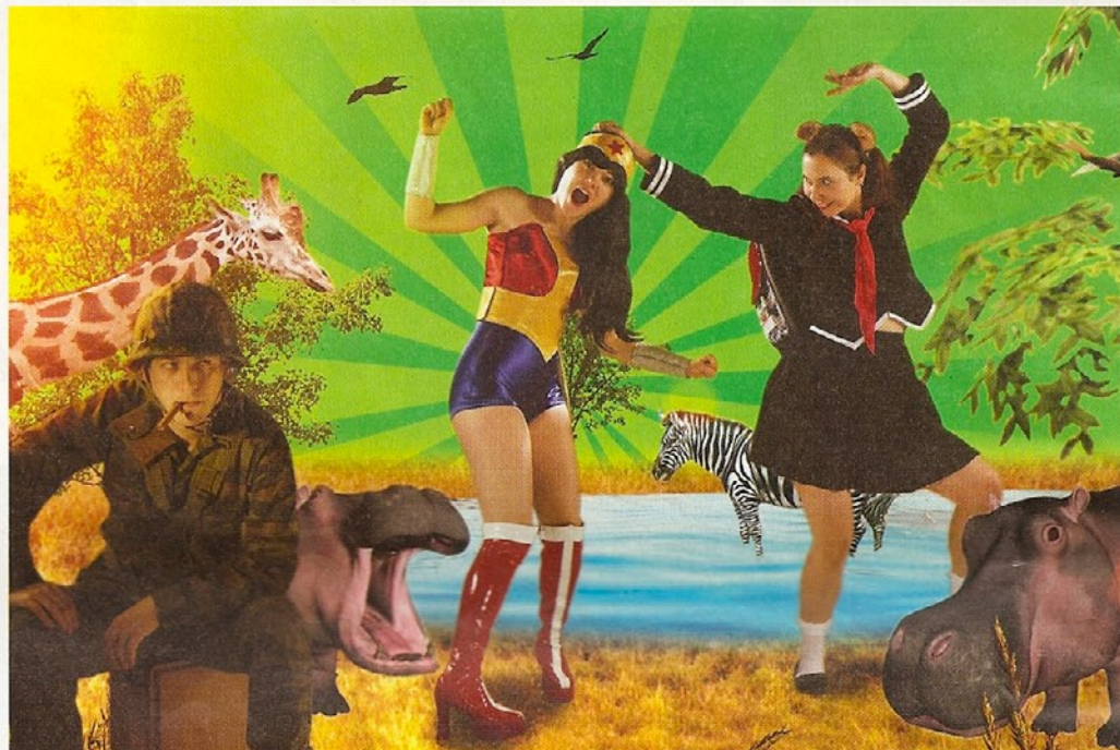
© DANILE BALMAT, BRIAN TORNAY, CHRISTIAN DENISART

Avec l'explosion des connexions internet apparaissent les «jeux massivement en ligne». Ils permettent